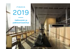
HALLINNOINTI- JA PALKITSEMISELVITYS